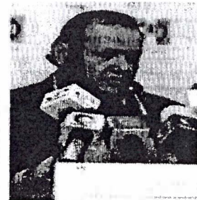
Héctor Pizano, presidente del PRI

Por su parte, el actual alcalde de dicho municipio, Alejandro Macías Velasco, dijo que las anomalías se detectaron en obra pública, rubro en el que se facturaron proyectos que no se realizaron de acuerdo a lo estipulado o a sobreprecio; se admitieron deudas con proveedores sin existir una factura que justifique los servicios, y se enajenaron bienes en términos y condiciones contrarias a lo que marca la ley.